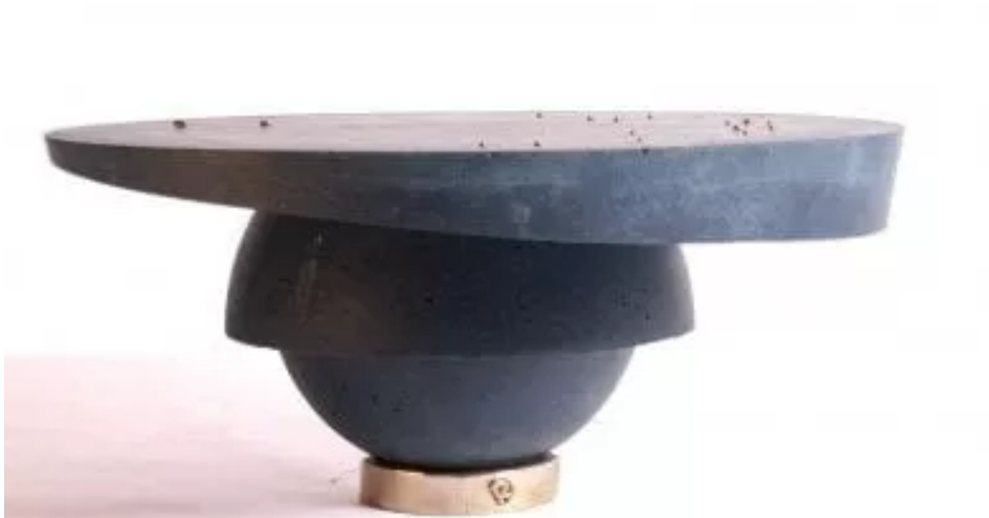
Il tavolo Sandcastles di Ruben van Megen

Nelle scorse edizioni erano Ventura e Centrale, ora Certosa Initiative per riflettere su sostenibilità e nuovi materiali tra ex officine e capannoni dismessi